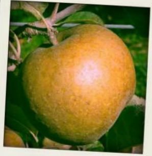
Court Pendu Gris

Variété très productive et très peu sensible aux maladies. Fruit très résistant au transport