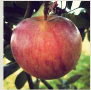
Belle Fille de l'Indre