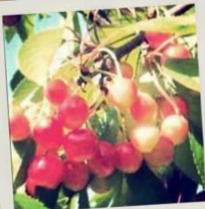
Belle du Berry ou Petite Joue Vermeille