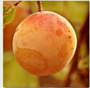
Très grosse mirabelle