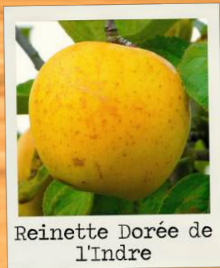
Reinette Dorée de l'Indre