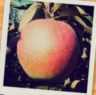
Bec d'Oie du Cher

Peu sensible à la tavelure et à l'oïdium, un peu sensible au chancre. Bonne production sur formes moyennes et hautes. Très bonne conservation