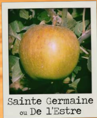
Sainte Germaine ou De l'Estre