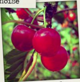
Triaux de Fondettes