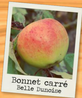
Bonnet carré Belle Dunoise