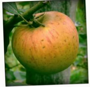
Reinette de Villerette

Assez résistante aux maladies courantes. Excellente variété d'automne pour la table