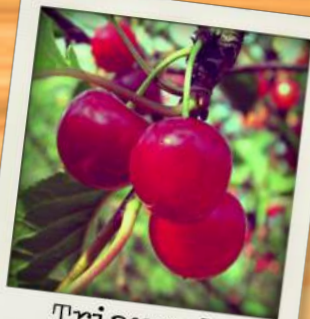
Triaux de Fondettes