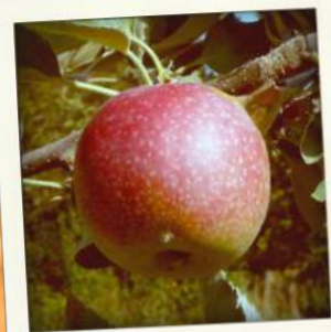
Jacquet de l'Indre