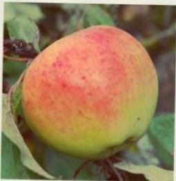
Bonnet carré Belle Dunoise