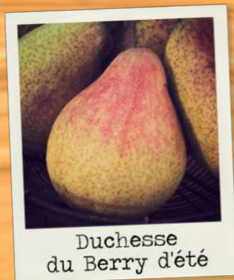
Duchesse du Berry d'été

Peu sensible aux maladies courantes, il faut la cueillir avant maturité.